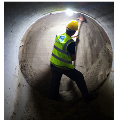
为确保节点工期按时完成,养护公司正定西污分流项目正在紧张有序进行工作并开挖与支护、顶管作业。全标段以打造品质工程为目标,趁着施工“黄金期”,全面掀起大干热潮。(吕文博)