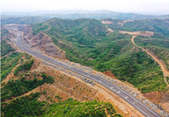
科技发展公司参建的唐县农村公路建设项目正加紧施工,唐县在实施西部山区乡村产业振兴过程中,以“修建一条公路,带动一片产业,造福一方百姓”为理念,不断加大山区农村产业公路规划建设力度,完善基础设施,构建山区农村产业路网,推动乡村产业发展步入“快车道”。(王亿伦)