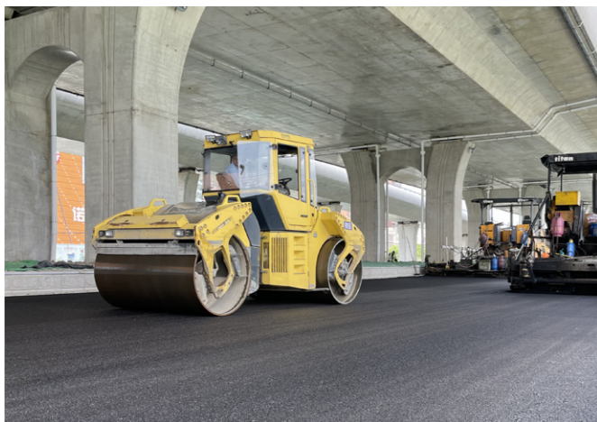
第一公司南通江海大道东延项目正在进行地面道路路面施工,现场施工管理人员不畏酷暑,不分昼夜,抢抓施工黄金时间,参与建设的工人们分工合作,正在潮湿闷热的环境中进行钢筋钻眼作业,一派热火朝天的景象。(江建飞)