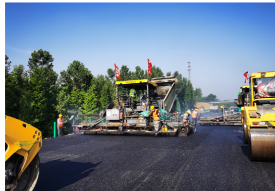
6 月 2 日,随着最后一车沥青混合料缓缓倒入摊铺机内,第六公司沪陕高速改扩建工程 06 标项目左幅 K728+200-K728+800 沥青混凝土中面层试验段施工顺利完成,试验段顺利摊铺完成,为下一步大规模面层施工、全面实现重要节点计划创造了有利条件。(潘伟所)