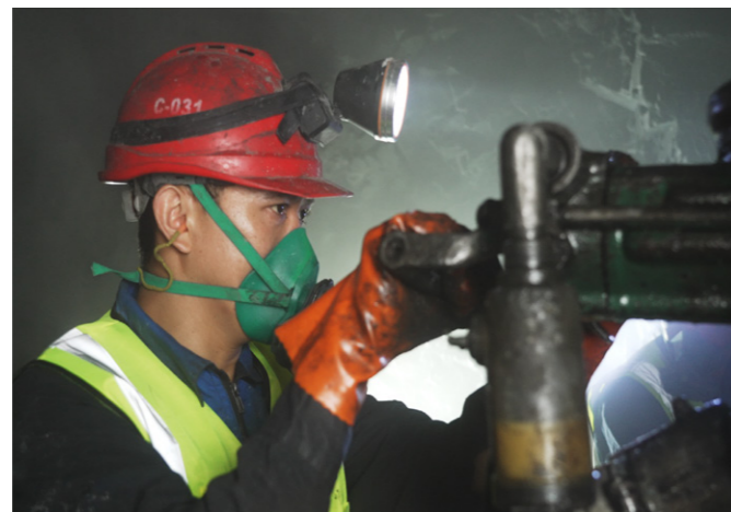
炎炎夏日,建设发展公司湖北西气东输三线中段工程项目施工现场机械轰鸣,隧道内热浪滚滚、烟尘弥漫,赶进度、保工期,参与建设的工人们分工合作,正在潮湿闷热的环境中进行钢筋钻眼作业,一派热火朝天的景象。(江建飞)