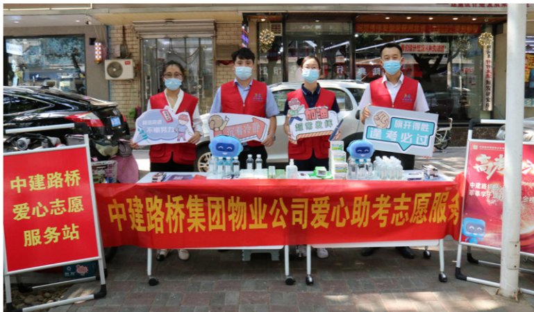
这次爱心助考志愿服务活动得到了在场考生和家长的好评和认可,营造了一个安静的考试环境及和谐温暖的氛围,展现了中建路桥的国企担当和社会责任。

此次志愿服务活动,中建路桥青年员工以实际行动践行初心和使命,彰显央企的责任与担当,用自己的爱心、热心帮助弱勢儿童,让他们感受到社会大家庭的温暖。同时也呼吁社会要共同关心关注弱勢儿童,在生活上给予他们更多的关怀和帮助。下一步,保通公司将持