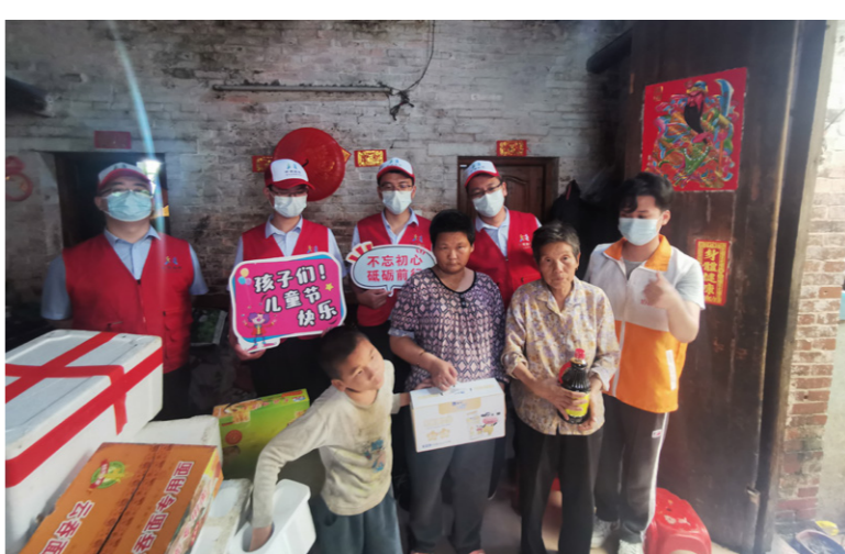
持续关注社会弱势群体,弘扬企业正能量,引导员工广大职工投身志愿服务,塑造企业良好形象。