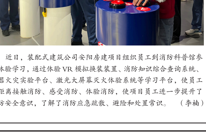
近日，装配式建筑公司安阳房建项目组织员工到消防科普馆参观体验学习。通过体验VR模拟模拟火灾、消防知识综合查询系统、电器火灾实验平台、激光大屏幕火灾体验系统等学习平台，使员工零距离接触消防、感受消防、体验消防，使项目员工进一步提升了消防安全意识，了解了消防应急疏散、避险和处置常识。（李博）

为激发科技创新活力，一是建立健全科技研发、科技成果转化、科技成果应用实施三级组织导师制，落实每一项科研项目责任，为项目科技创新和“泛应用”“四新”技术成果提供坚实组织保障；二是把学习贯彻习近平新时代中国特色社会主义思想作为首要政治任务，把开展专题学习、组织专项培训与学习贯彻党的二十大精神相结合，依托弘扬红色文化和红色资源，开展丰富多彩的主题团日活动，学党史、悟思想、传承红色基因，凝聚起团结奋斗的磅礴力量；三是设置“党员责任区”“党员先锋岗”“党员先锋队”，激励党员干部增强使命担当，提升应对急难险重工程施工能力和科技成果在生产工程中的应用能力，不断提升项目安全生产和科技创新；四是把劳动竞赛为抓手，广泛组织合理化建议、岗位练兵、技术革新等实践活动，鼓励广大员工积极参与科技创新，发明更多“绝活绝技”，助力攻克“卡脖子”技术难题。韩口隧道的通车运营，将极大促进山西山西省经济文化交流，对晋豫煤炭运输、文旅产业及太行山区破晓发展必将产生重要促进作用，同时对构建黄河生态经济带战略也具有重大意义。（赵广胜）