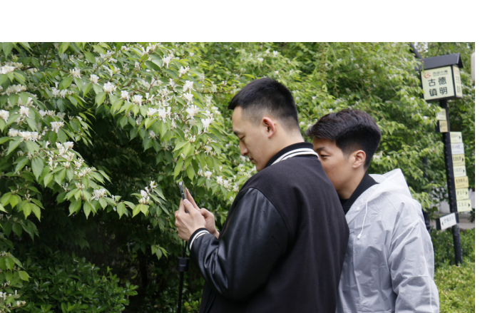
近日，物业公司组织通讯员赴石家庄西部长青开展新闻宣传摄影培训。大家纷纷表示受益匪浅，在今后的工作中不断加强学习，全力讲好路桥好故事，传播中建好声音。（郭芬）