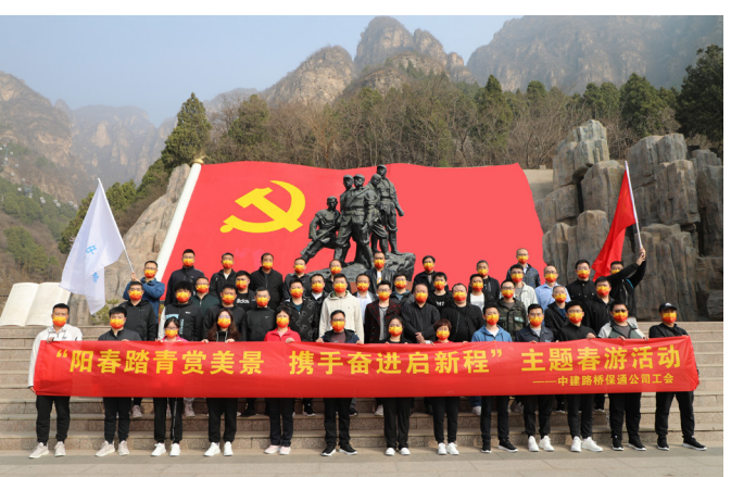
近日，保通公司组织职工前往狼牙山开展“阳春踏青赏美景 携手奋进新征程”主题教育团课。活动中，大家参观了狼牙山五勇士纪念馆，登上了巍峨矗立的狼牙山峰，感悟革命先烈坚定不移的革命信念，欣赏沿途壮丽风景。（范翔宇）