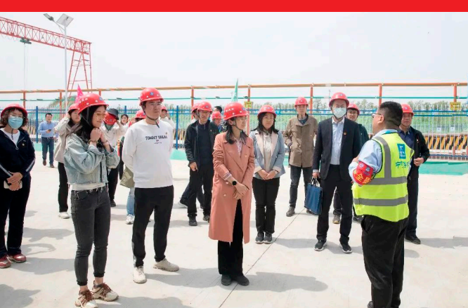
4月28日，为纪念“五四”运动104周年，北广广播电视台等16家单位共计30余人参加。

引领，积极发挥共青团服务青年、组织青年、凝聚青年作用，促进青年人才交流互动，服务青年人才成长进步，由集团团委牵头，联合河北省直属机关共青团组织第四区成员单位，前往石太高速改扩建项目3分部开展了“走进石太、感受基建魅力”开放日暨五四主题团日活动。省直团工委，河北银行、省卫健委、河北广播电视台等16家单位共计30余人参加。