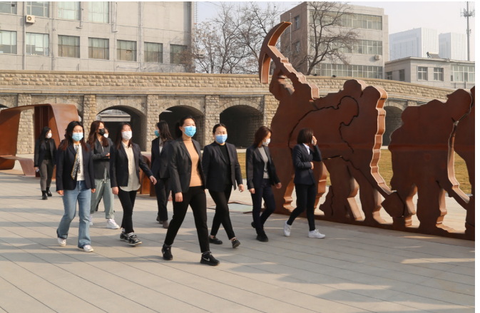
近日，由中建路桥承建的世界最长螺旋隧道——新晋高速转口隧道通车运营，标志着新晋高速全线贯通。从山西晋城到河南新乡的路程较过去的3个多小时缩短到1个多小时。新晋高速位于河南与山西两省交界处，连接河南新乡与山西晋城，盘绕穿越太行山脉内部，形成了28公里的螺旋隧道群。从陵川县海拔1280米的王莽岭隧道到海拔500米的新乡市马鸣湖，9个隧道宛如一条螺旋线，在太行山蜿蜒下降两圈半。其中，中建交通旗下中建路桥承建的转口隧道是目前世界最长的螺旋隧道。

岩等级。把岩岩等级通过颜色展现在三维图上，红色代表危险程度高的V级，绿色代表相对安全的III级。只需看线，技术人员就明白对不同的岩岩要采取不同的开挖方式。这套信息系统还连接了洞内空气质量监测设备，实时监测施工空气质量和氧气含量，确保项目安全生产整体平稳健康发展。项目获评“2021年度河北省青年安全生产示范岗”“2022年度全国青年安全生产示范岗”“2022年度第二批河南省建设工程安全生产标准化工地”等荣誉。