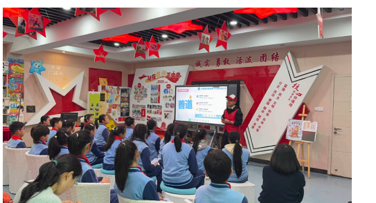
第一公司机关党支部开展“弘扬雷锋精神 共建健康家园”主题活动

本报讯（通讯员 张小科）为深入贯彻雷锋精神，推动学雷锋活动常态化、进校园，3月27