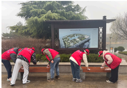
传承雷锋精神 践行青春担当

此次志愿服务活动，不仅有效清除了河道垃圾，改善了河道生态环境，减少了垃圾对水体的污染，守护了河道的洁净与畅通，更将雷锋精神与生态文明建设深度融合，以实际行动守护“一泓清水、传递文明正能量”。