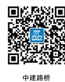
中建路桥企业微信号二维码