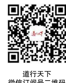
道行天下微信订阅号二维码