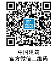
中国建筑官方微信二维码