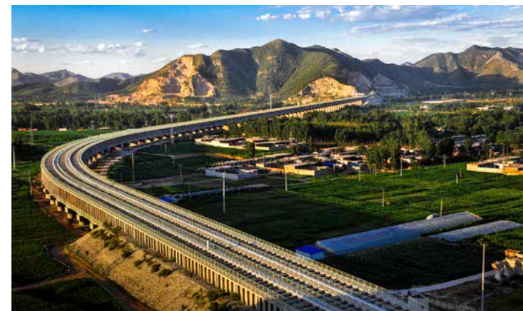
梁风华《南水北调架金桥》