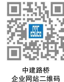
中建路桥企业网站二维码