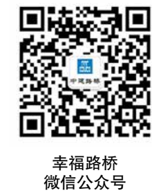
幸福路桥微信公众号