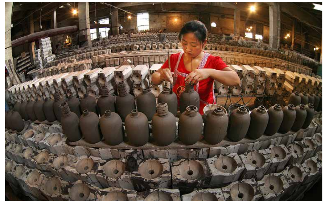
李志文《磁州窑烧制技艺》