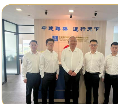
丝路公司市场营销团队