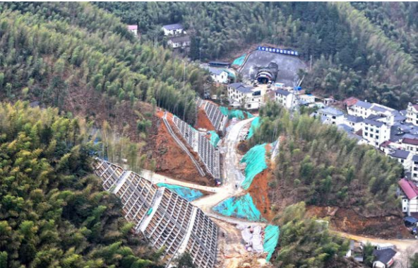
衢州石七线项目的攻坚克难之路

由中建路桥集团第一公司承建的七里至石梁段公路工程项目的核心难点在于其复杂的地形条件，花岗岩隧道作为全线控制性工程，屡越岭隧道，施工风险极高。此外，全线27座桥梁中，有24座位于曲线段，最大桥梁墩高40余米，架梁精度要求严苛。项目部通过多次专家论证、安全技术交底及实时监测，确保爆破精准可控。2024年11月，大头桥2号桥墩盖梁首件浇筑完成；2024年12月，隧道首次爆破作业完成，为后续掘进奠定基础。