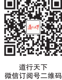
道行天下微信订阅号二维码