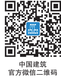
中国建筑官方微信二维码