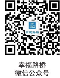
幸福路桥微信公众号