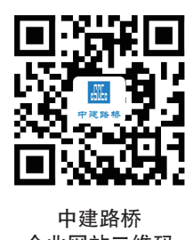
中建路桥企业网站二维码