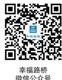
幸福路桥微信公众号