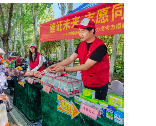
本次活动，公司青年志愿者们用细致周到的服务传递温暖，积极践行企业社会责任，以实际行动为广大高考学子加油鼓劲，全面彰显企业热心公益、担当奉献的良好风貌。

本次活动是青岛项目联合党支部深化廉洁教育、涵养清廉企业文化的生动实践。通过端午佳节传统文化契合与常态化廉洁警示教育深度融合，职工真切领悟“粽有千般好，廉为第一味”的深刻内涵，切实强化全体职工廉洁自律意识，凝聚队伍向心力，为公司高质量发展筑牢思想根基。