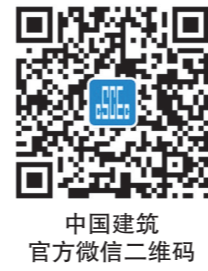
中国建筑官方微信二维码