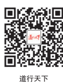
道行天下微信订阅号二维码