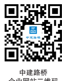
中建路桥企业网站二维码