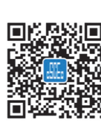
中建路桥微信企业号二维码